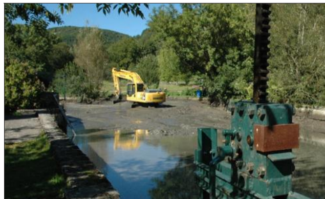
Le fond de l'étang réapparaît après 35 ans

Un terrassier, muni d'une grosse pelle mécanique, a procédé à ce nettoyage spectaculaire qui a attiré la foule des curieux pendant plusieurs jours. Ce sont près de cinquante camions de vase qui ont été ainsi retirés avant que le véritable fond ne réapparaisse, que l'eau s'éclaircis-